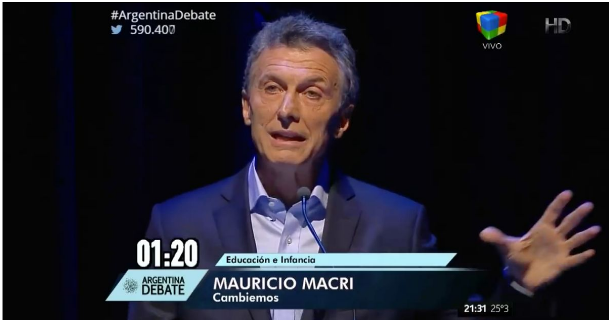
Macri utilizando sus manos a su lado izquierdo.