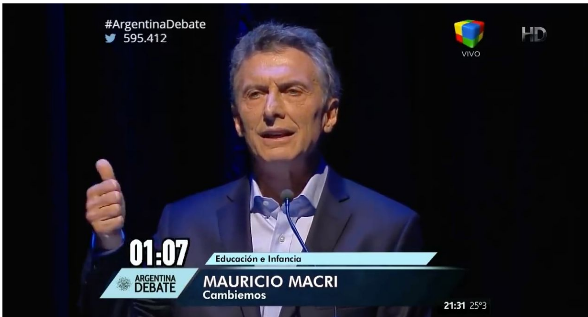
Macri utilizando los dedos para enumerar.