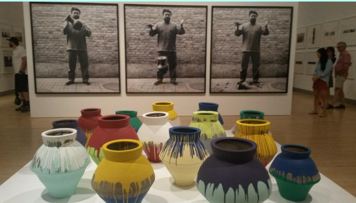
Ai Wei Wei, Colored vases , 2007-2010