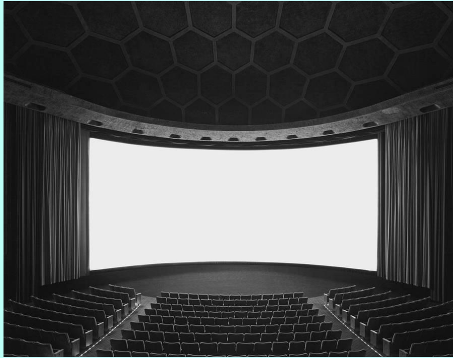
Hiroshi Sugimoto, "Cinerama dome", Hollywood, 1993