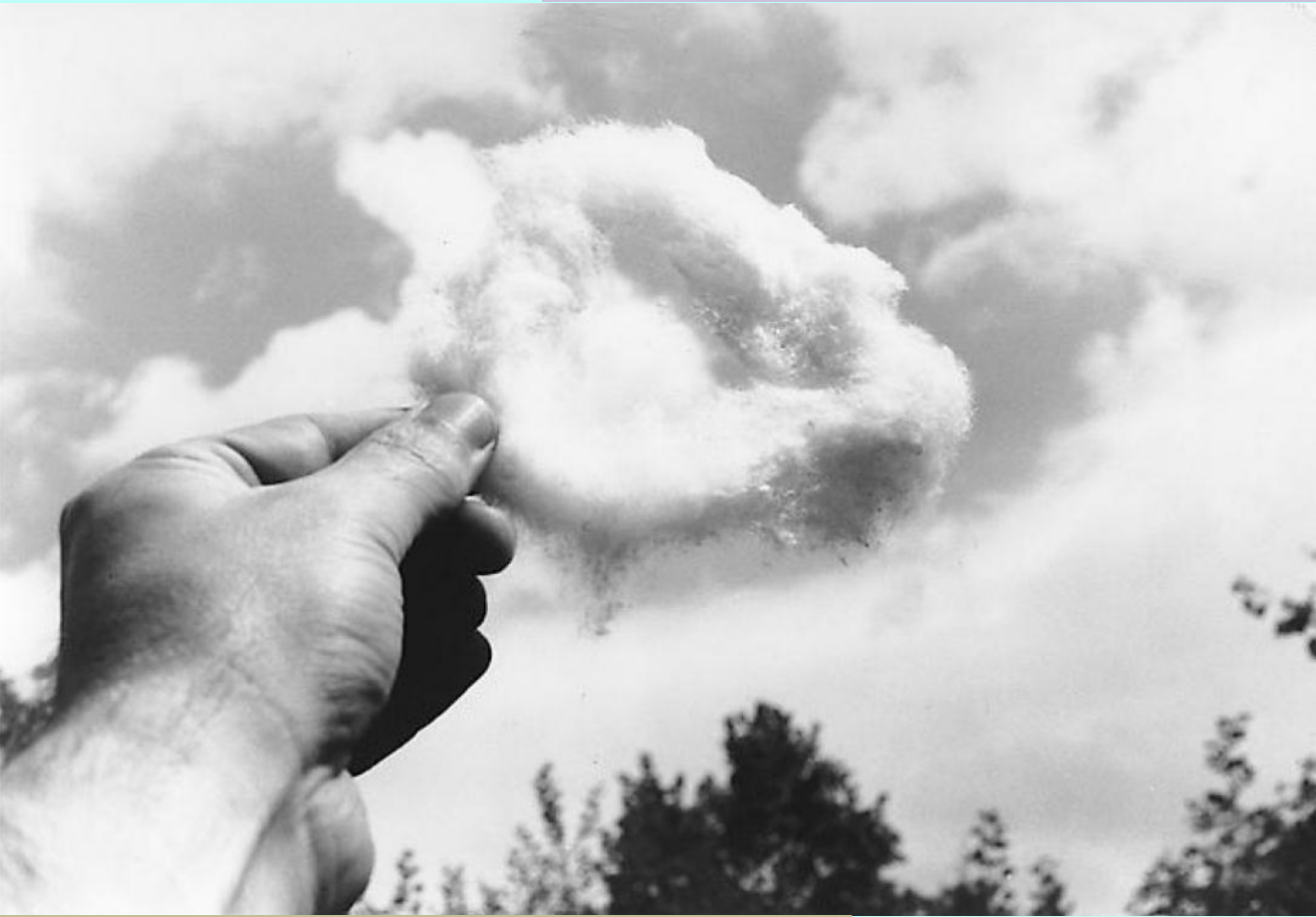
Luis Camnitzer, El descubrimiento de la geometría , 1978