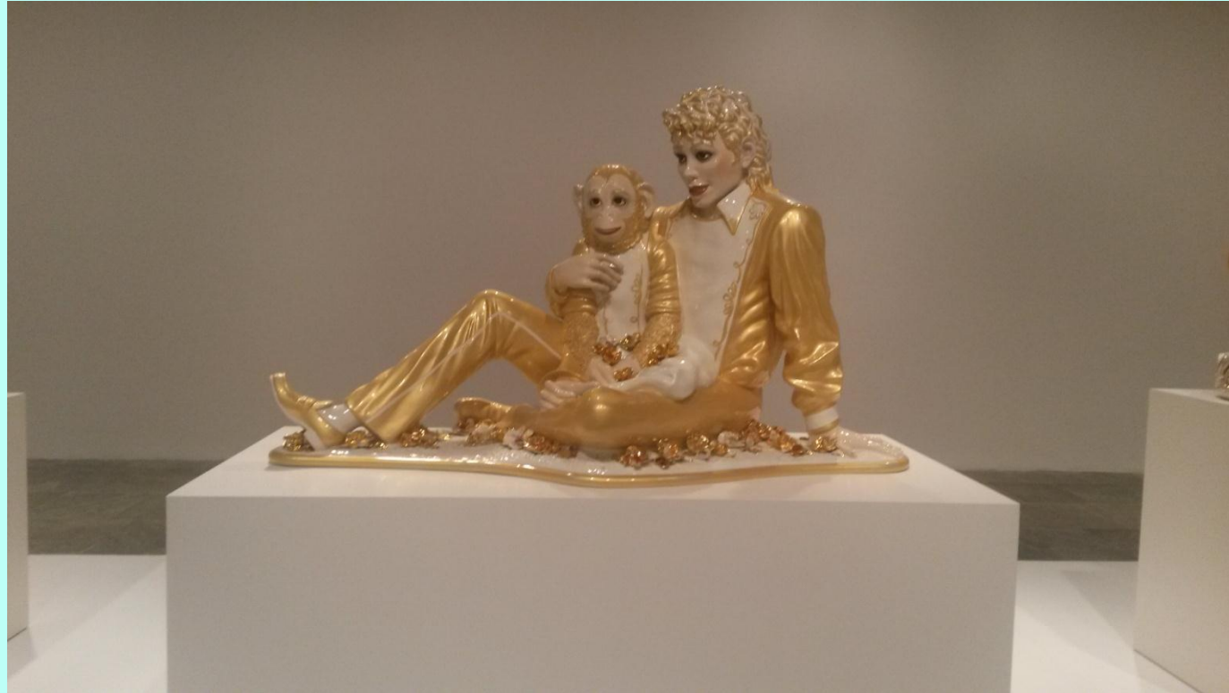
Michael Jackson and bubbles, Jeff Koons, 1988