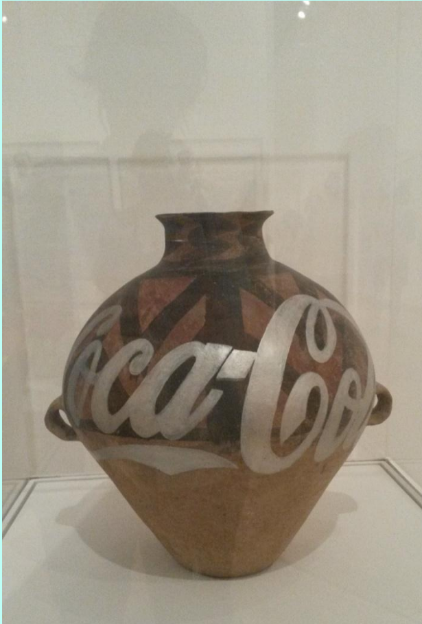
Coca Cola Vase, Ai Wei Wei, 2007