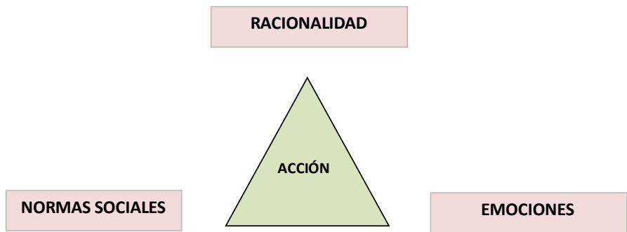
Figura Nro. 1: Teoría de la Acción Fuente: Elster (1989)

puede ser vista como normativa o prescriptiva. Como teoría normativa, nos indica cómo debemos proceder para alcanzar ciertas metas lo mejor posible, aún sin saber cuáles han de ser esas metas. Como teoría prescriptiva, nos brinda el soporte para predecir determinadas acciones.