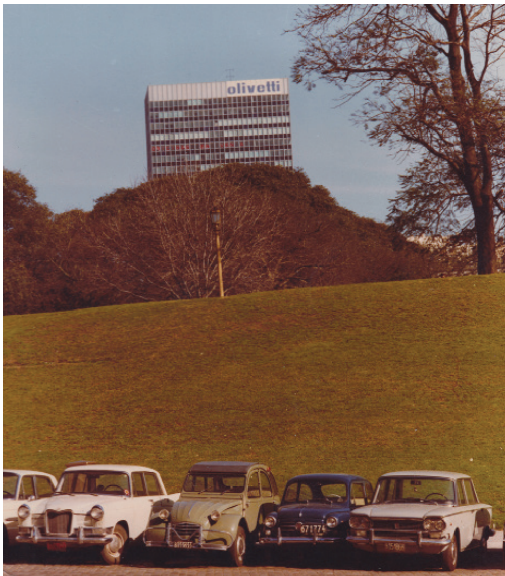
Edificio central de Olivetti en Buenos Aires, ca. 1960. Archivo Fundación +D+A. Buenos Aires.