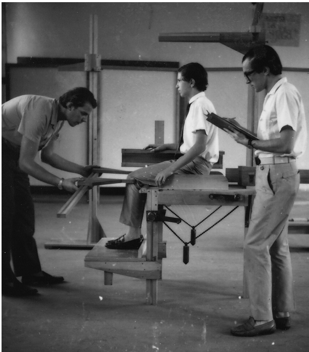
IDI, Instituto de Diseño Industrial, Archivo Fundación +D+A, Buenos Aires.