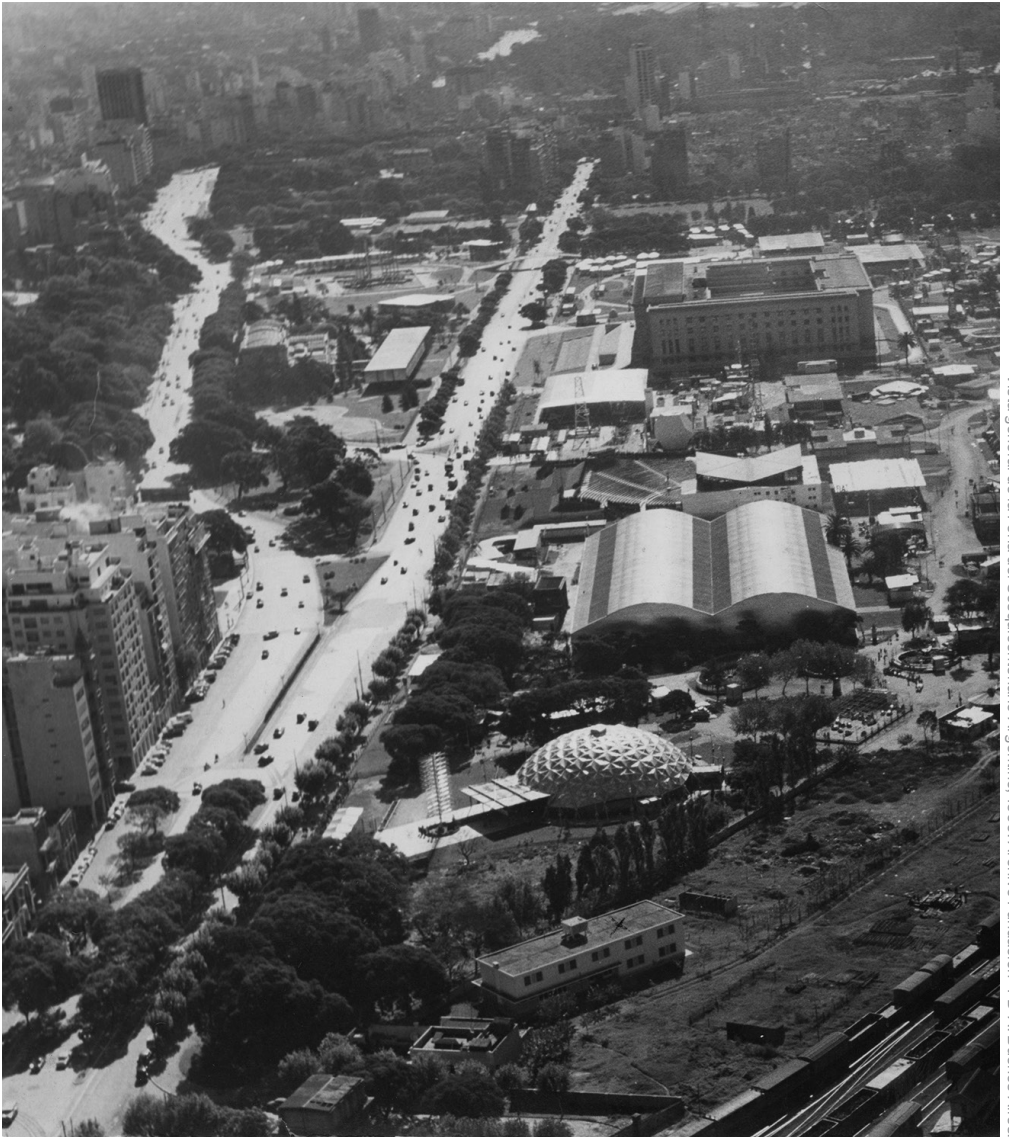
Vista general de la Feria del Sesquicentenario Argentina, 1960.