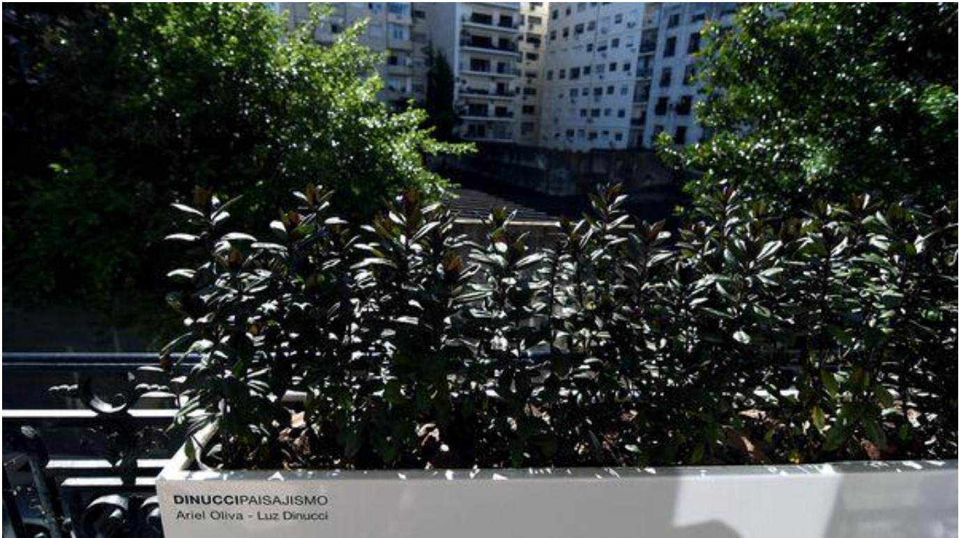
Nicolás Stulberg 162

Los paisajistas Luz Dinucci y Ariel Oliva se valieron de líneas simples e intentaron enmarcar a la vez que resaltar los detalles más relevantes. Realizaron un juego de contrastes entre curvas y rectos, entre lo antiguo y lo actual. Impulsaron una fusión de épocas.