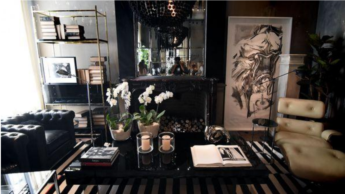
Nicolás Stulberg 162

En la Planta Baja de la casona, el diseñador de interiores Pablo Chiappori buscó desarrollar un justo equilibrio entre la fachada original y su propuesta de ambientación. Así, la sala de estar adoptó un estilo chic , armónico, relajante y ecléctico. Con terciopelo, vidrios negros, maderas texturadas, níquel, rattan, lacas, bronce, fieltro y cristal logró conjugar lo mejor de ambos mundos.