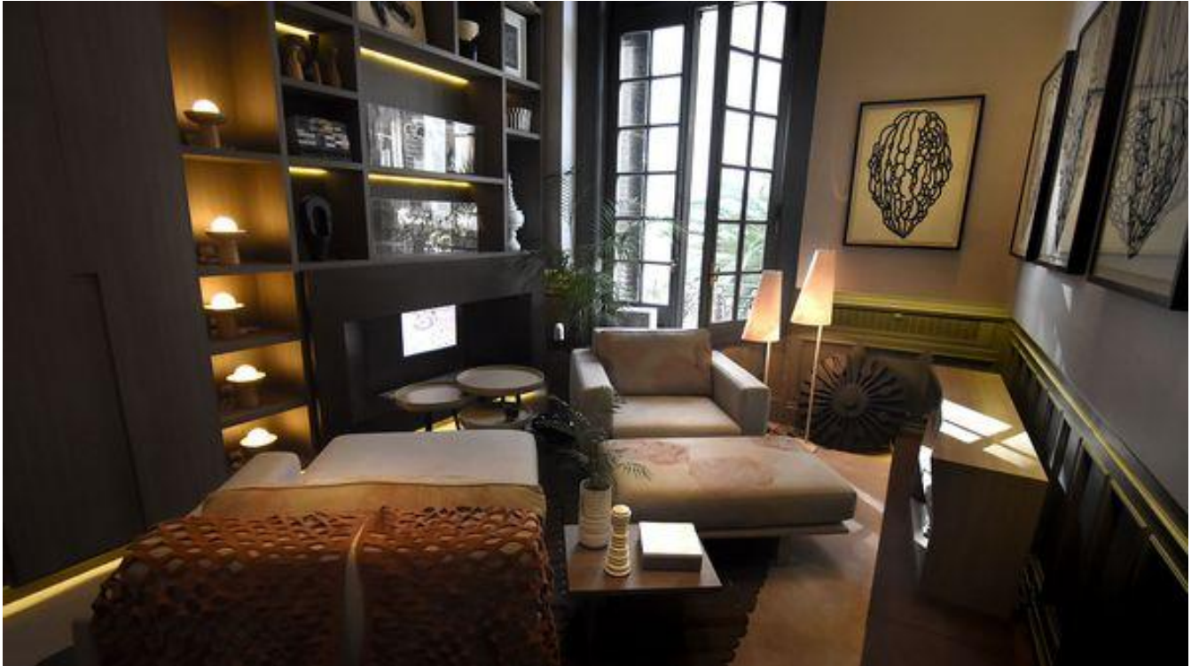
162