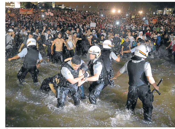
Choques entre la policía y los manifestantes en las fuentes del Congreso en Brasilia, anoche

TENSIÓN. Protestas por aumentos en los transportes derivaron en un violento reclamo