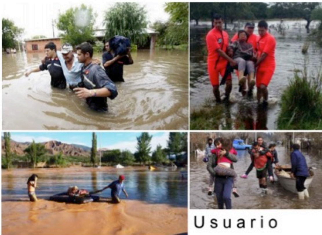
U s u a r i o